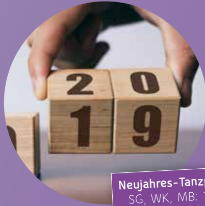
Neujahres-Tanzparty SG, WK, MB: 11.1.

Schaut euch doch einmal die Videos und Fotos der vergangenen Jahre auf unserer Website an. Alle Infos unter: www.tanzschule-mavius.de