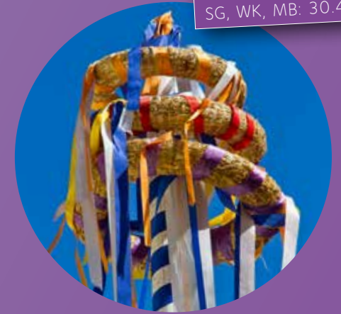
Tanz in den Mai SG, WK, MB: 30.4.