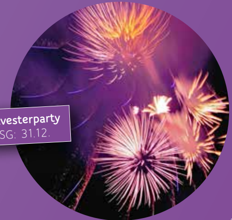
Silvesterparty SG: 31.12.