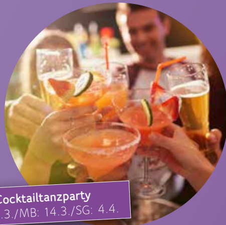
Cocktailtanztanzparty WK: 7.3./MB: 14.3./SG: 4.4.